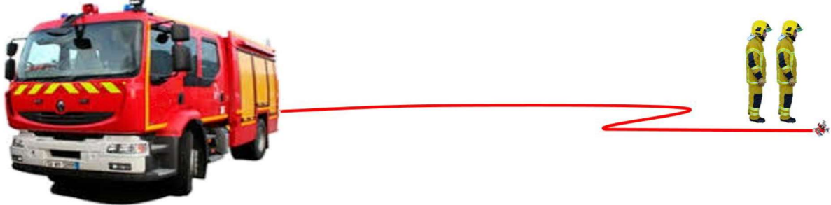
Illustration n°1 : schéma de principe de l'établissement d'une division d'alimentation (dévidoir mobile, tuyaux en couronne ou en écheveaux)

Objectif : Cet établissement doit alimenter les lances. L'usage de tuyaux de diamètre 70 permet de limiter les pertes de charge.